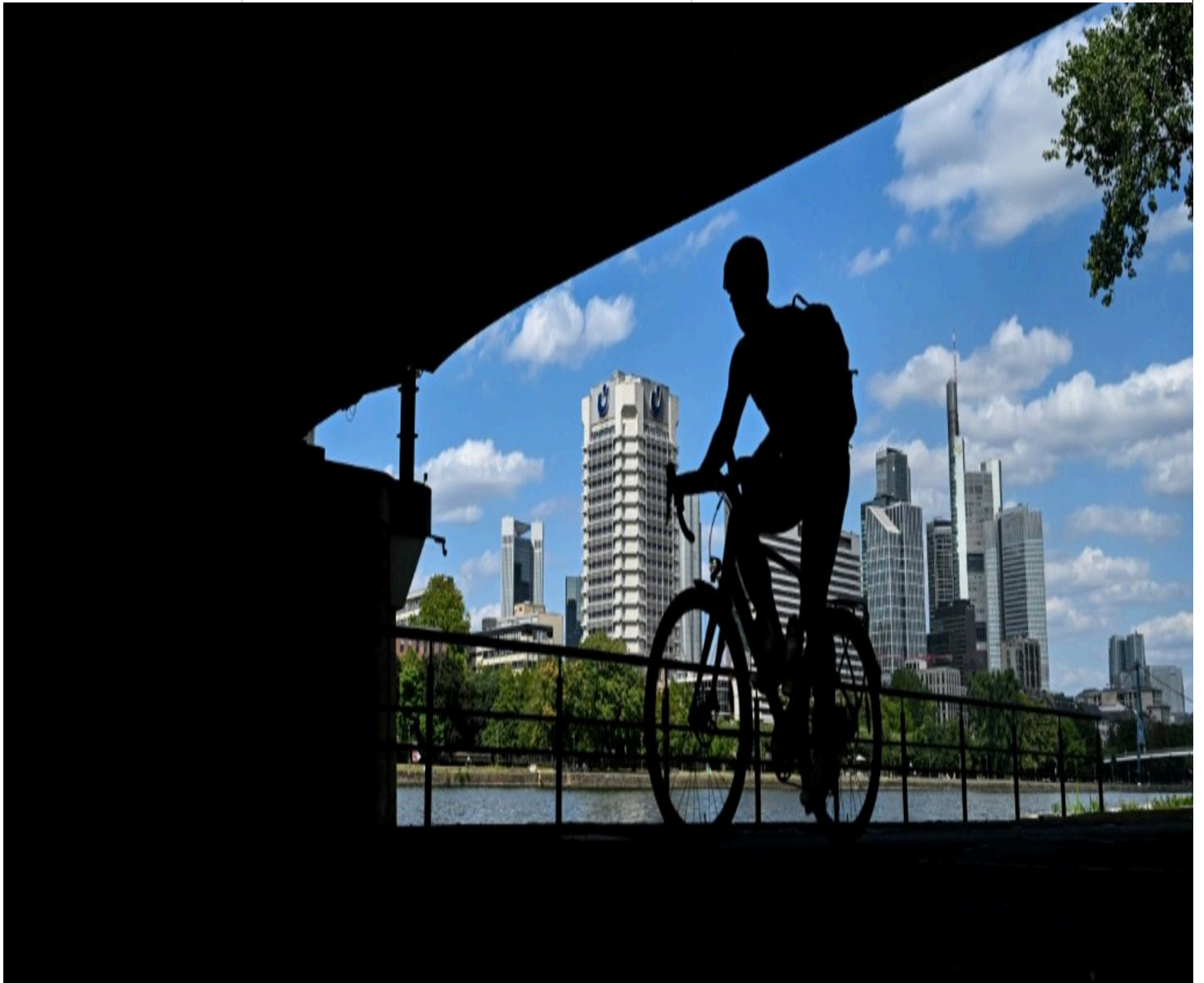
Fahrradfahrer in Frankfurt am Main