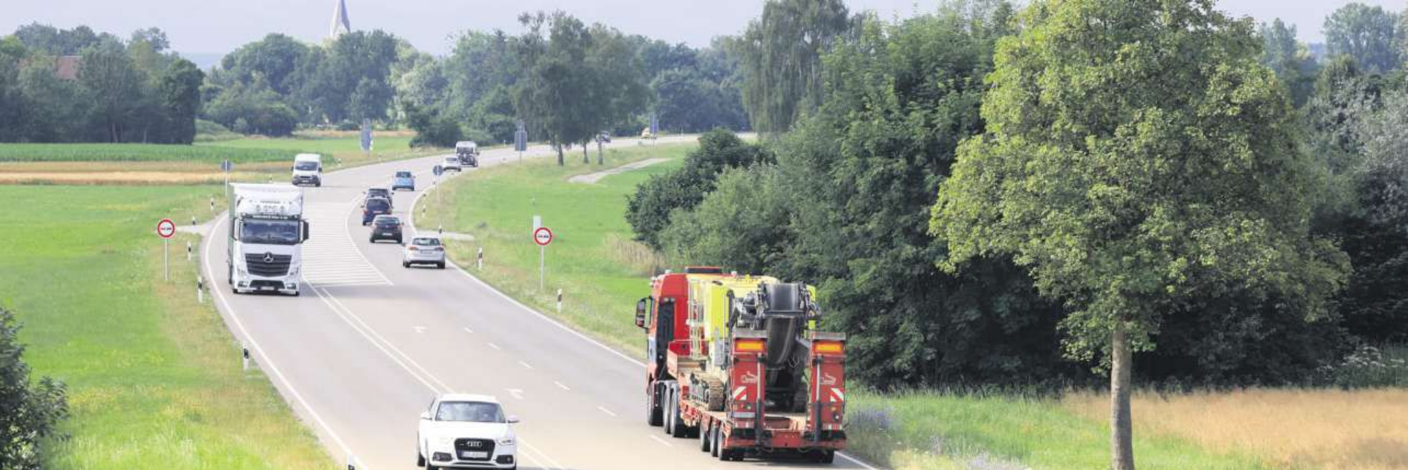
Für den nördlichsten Abschnitt der Bundesstraße 12 im Allgäu zwischen Germaringen und Buchloe gibt es bereits eine Baugenehmigung. Allerdings muss zunächst eine Klage gegen dieses Teilstück bearbeitet werden.